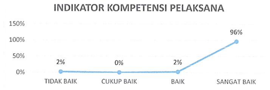
Gambar 4. 6 Kepuasan Pengguna Layanan Pengadilan Negeri Tangerang Kelas I A Khusus