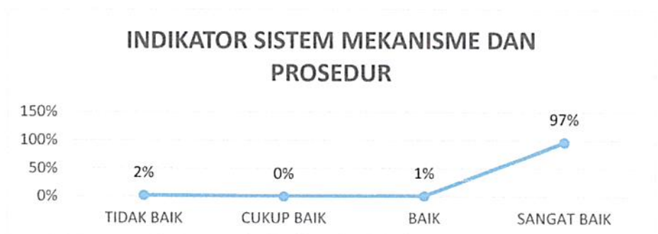
Gambar 4. 2 Kepuasan Pengguna Layanan Pengadilan Negeri Tangerang Kelas I A Khusus Indikator : Sistem, Mekanisme dan Prosedur