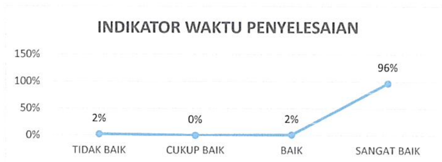
Gambar 4. 3 Kepuasan Pengguna Layanan Pengadilan Negeri Tangerang Kelas I A Khusus Indikator : Waktu Penyelesaian