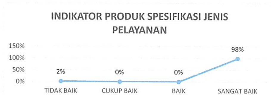
Gambar 4. 5 Kepuasan Pengguna Layanan Pengadilan Negeri Tangerang Kelas I A Khusus Indikator : Produk Spesifikasi Jenis Pelayanan