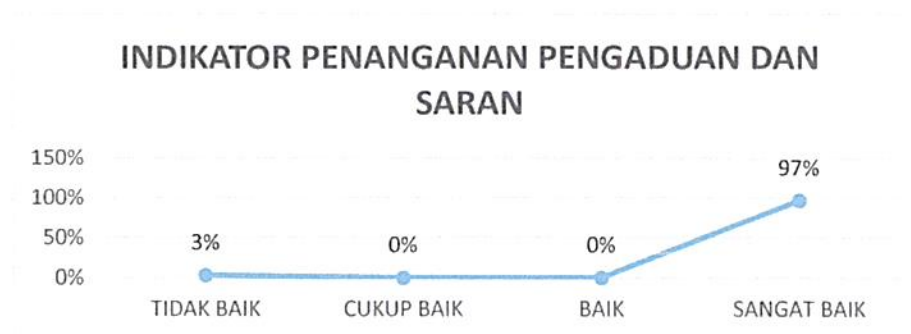
Gambar 4. 9 Kepuasan Pengguna Layanan Pengadilan Negeri Tangerang Kelas I A Khusus Indikator : Penanganan Pengaduan dan Saran