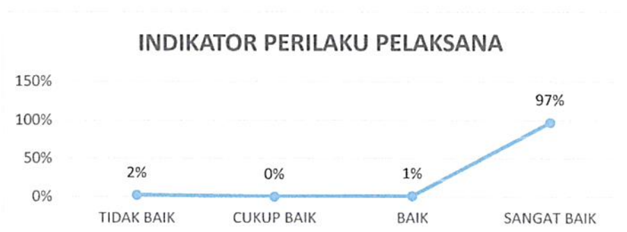
Gambar 4. 7 Kepuasan Pengguna Layanan Pengadilan Negeri Tangerang Kelas I A Khusus Indikator : Perilaku Pelaksana