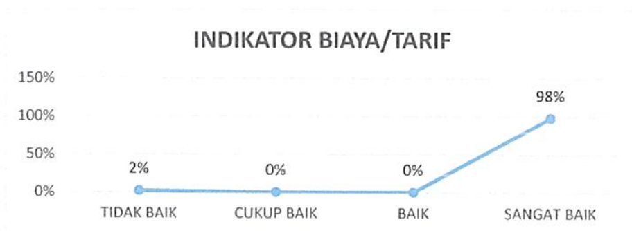
Gambar 4. 4 Kepuasan Pengguna Layanan Pengadilan Negeri Tangerang Kelas I A Khusus