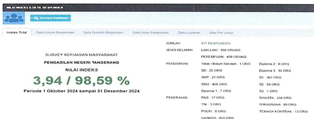
Gambar 4. 10 Hasil Survey Kualitatif