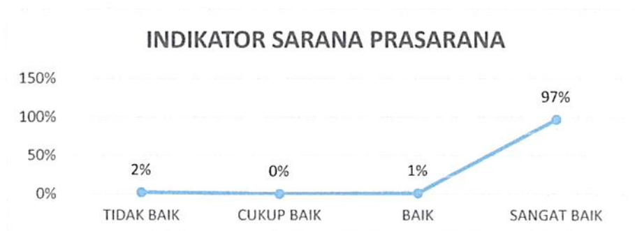
Gambar 4. 8 Kepuasan Pengguna Layanan Pengadilan Negeri Tangerang Kelas I A Khusus Indikator : Sarana dan Prasarana