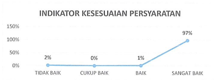
Gambar 4. 1 Kepuasan Pengguna Layanan Pengadilan Negeri Tangerang Indikator : Kesesuaian Persyaratan